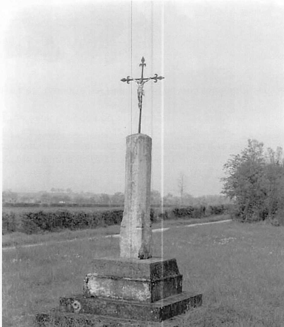
Photo : Archives – Inventaire général du patrimoine Région Normandie - 1981