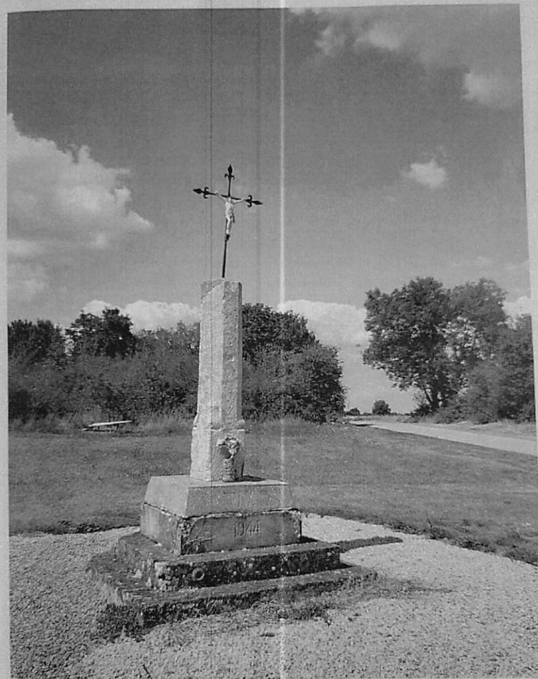
La Croix Saint Clair au Val aux Malades